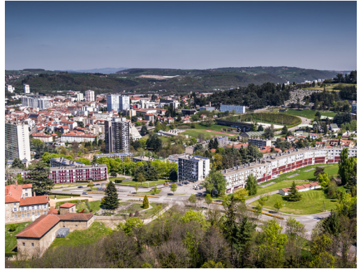
Vue de Firminy-Vert aujourd'hui (1961, architectes C. Delfante, J. Kling, M. Roux et A. Sive) et de la Maison de la Culture (1965, architecte Le Corbusier)